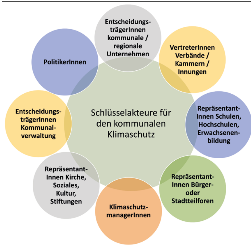
Abbildung 27: Akteure im kommunalen Klimaschutz